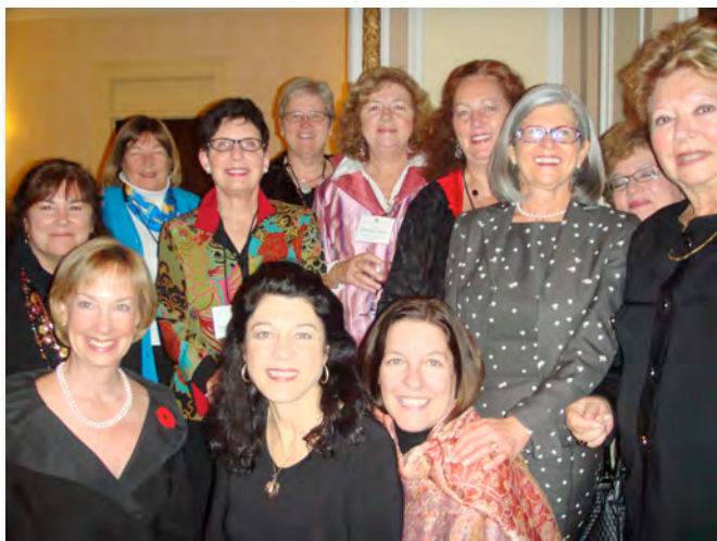
Conseil d'administration 2009-2010